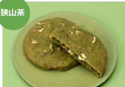
狭山茶&くるみ&ホワイトチョコ 1枚 324円 marl (エキュート大宮)