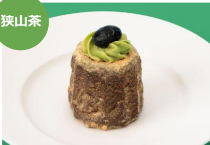
狭山茶のカヌレ 1個 320円 立町カヌレ (エキュート大宮)