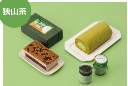
狭山茶プリン 1個 600円 狭山茶パウンドケーキ 1個 1,404円 狭山茶ロールケーキ 1本 2,376円 那須ジャージーマリアージュ (エキュート大宮 ノース)