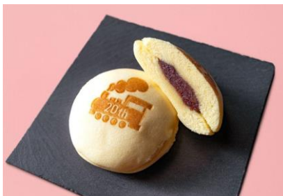
20周年記念 鉄道繭衣 1個 237円 銀座甘楽 (エキキュート大宮)

人気のエッグドシャが、イーストアイと185系の列車を描いた限定缶で登場。サクッとした軽快な食感と、繊細なくちどけをお楽しみください。 ※1日20缶限定 ※JR東日本商品化許諾済