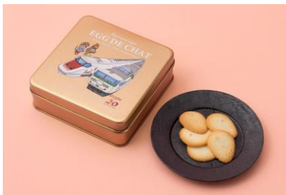
エッグドシャ エキキュート大宮20周年記念缶 1缶 2,000円 ランメイシャ スイーツファクトリー (エキキュート大宮)

サザコーヒー鈴木太郎の「鉄道」への憧れをのせた特別なコーヒー。赤はエチオピア、青はケニアを深煎りに仕上げました。