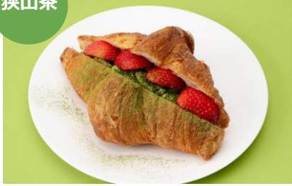
狭山茶といちごのクロワッサンサンド 1個 777円 ブーランジェリー ブルディガラ (エキュート大宮)