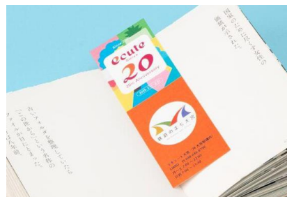
リブロ (エキキュート大宮)