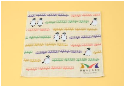
和たおるセミウォッシュ「シマエナガとトレイン 鉄道のまち大宮」 1枚 550円 濱文様 (エキキュート大宮)

さいたま市見沼区の竜伝承にちなんで伝説の「龍の玉」を模したお菓子。職人の手で丁寧に仕上げた薯蕷饅頭に、艶やかな羊羹をまとわせています。 ※期間中200個限定