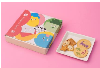
おおみやのおみや 10袋入 1,728円 赤坂柿山 (エキキュート大宮)