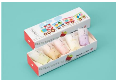
まゆ最中 5個入 700円 自由が丘 蜂の家 (エキキュート大宮)

ひとくちサイズのあられと玉子煎餅の詰合せ。カラフルなパッケージは20周年限定デザインです。 ※期間中300箱限定