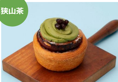
狭山抹茶のシナモンロール 1個 410円 ブランジェ浅野屋 (エキュート大宮 ノース)