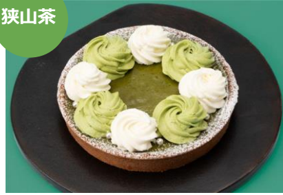
狭山茶タルト 直径1cm 2,880円 アンドメルシィ (エキュート大宮)