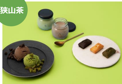
じえらーと埼玉・ぶりん埼玉 各561円 こ、ふいなんしえ3種限定セット 9個入 1,450円 埼玉粉問屋 つむぎや (エキュート大宮)