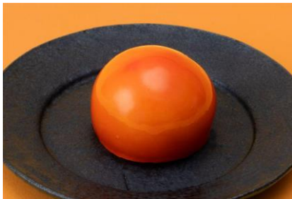
願い玉 1個 200円 菓匠右門 (エキキュート大宮)