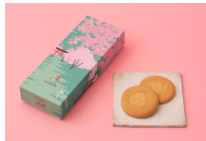
大宮びより 8枚入 1,180円 梅林堂 (エキキュート大宮)

繭のようにきめこまやかで、ふわっとした軽い食感の生地で契約農場産の小豆のあんをはさみました。焼印は20周年限定デザインです。