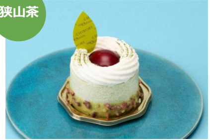
狭山茶レアチーズ 和茶 1個 777円 パティスリーチロリ (エキュート大宮)