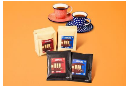
大宮鉄道 3351 EXPRESS COFFEE エキナカモカ/エキナカケニア 200g 各1,850円 サザコーヒー (エキキュート大宮)

濱文様で人気のセミウォッシュ。エキキュート大宮20周年を記念して、大宮限定デザインにて新発売。「鉄道のまち大宮」ロゴ入りです。