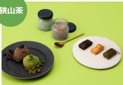
じえらーと埼玉・ぶりん埼玉 各561円 こ、ふいなんしえ3種限定セット 9個入 1,450円 埼玉粉問屋 つむぎや (エキュート大宮)