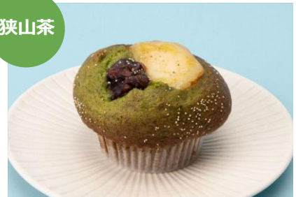
狭山抹茶とあずき豆乳クリーム 1個 345円 BAGEL&BAGEL my style plus (エキュート大宮)