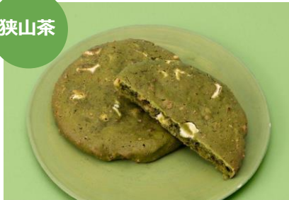
狭山茶&くるみ&ホワイトチョコ 1枚 324円 marl (エキュート大宮)