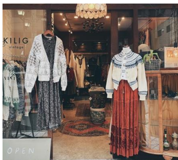
KILIG vintage 古着屋

間借りの花屋「soco」です。純粋にその時期綺麗で惹かれるお花、お客さまに似てるお花、街の人がきっと元気になるお花を仕入れています。流れの中で頭で色々な物事が混ざってsocoを表現できていたいなと思っています。