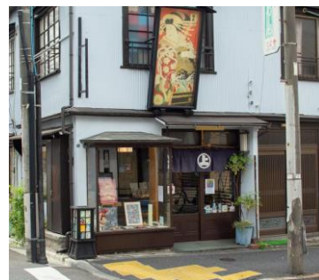
菊寿堂 いせ辰 雑貨

千駄木駅徒歩1分にある古着屋。ロサンゼルスでの買い付けをメインに60-80年代頃のヴィンテージアイテムを取り扱っています。特に、オリエンタルやエスニックな雰囲気ヴィンテージ服を取り扱っています。