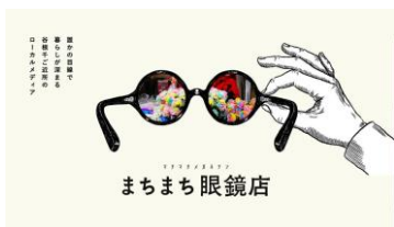
まちまち眼鏡店 本

江戸末期の1864年に神田元岩井町（現岩本町）で創業した江戸千代紙、おもちゃ絵の老舗・版元。店内には千種類にも及ぶ千代紙やおもちゃ絵があり、江戸の粋なデザインを施した和文具、おもちゃ、縁起の張子などがずらりと並びます。