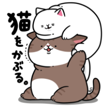
まんじゅうこわいこや！